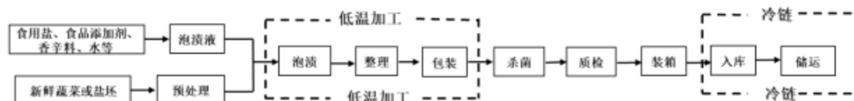
图1 泡渍泡菜低温加工及冷链储运工艺流程图