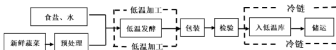
图3 发酵泡菜低温加工及冷链储运工艺流程图

发酵泡菜采用一定浓度的食盐或食盐水进行半干态或液态发酵，以乳酸菌主导发酵，采用 25℃左右的条件下发酵，入库和储运在 10℃以下的冷链条件下进行。